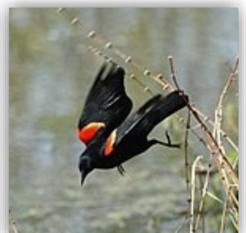
Carouge à épaulettes